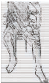
Fig. 5 Se la parte implicata è un'articolazione, prima dell'applicazione piegare leggermente l'articolazione stessa.