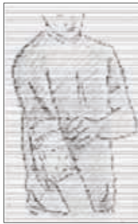
Fig. 6 Nel caso in cui TRANSACT Lat debba essere applicato su articolazioni molto mobili, come ad esempio il gomito od il ginocchio, è consigliabile l'uso del bendaggio di ritenzione accluso.

Applicare un solo cerotto medicato per volta sulla parte interessata ogni 12 ore.